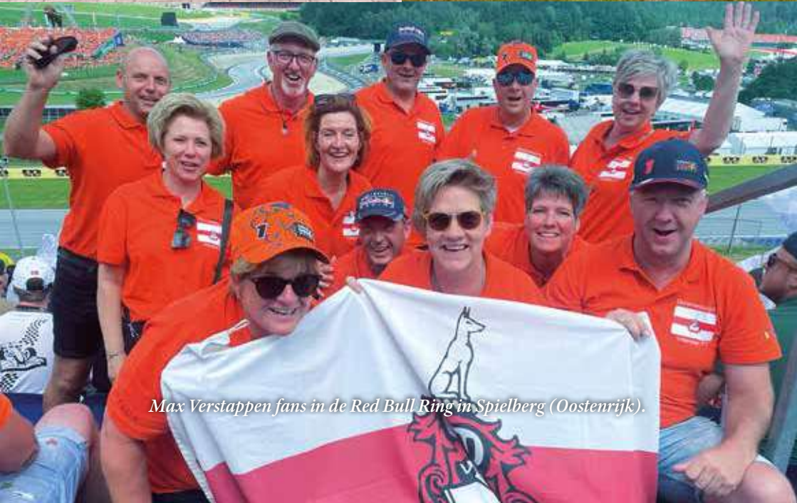
Max Verstappen fans in de Red Bull Ring in Spielberg (Oostenrijk).